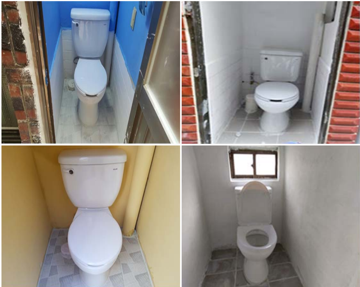
재래식화장실 개선사업 공사 후