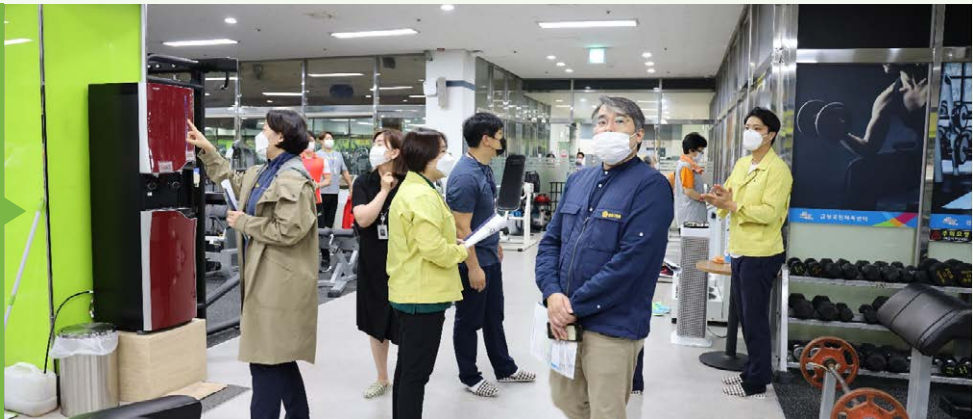
복지도시 위원회 현장방문