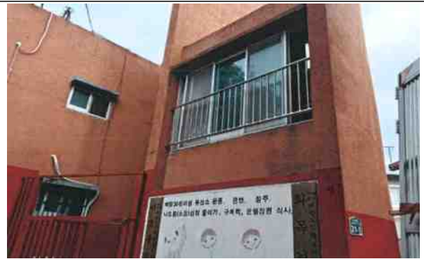
서3동경로당 (2층 난간대 신설)