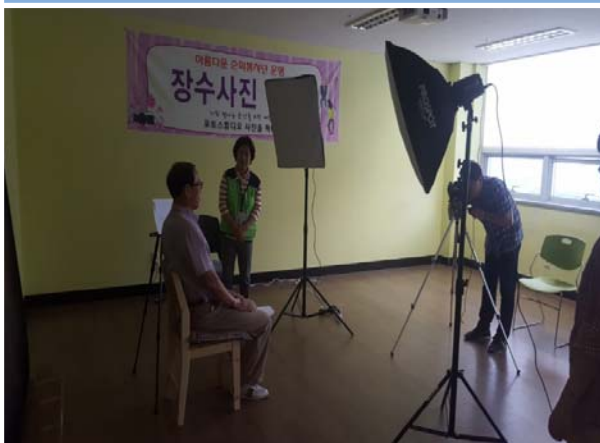
아름다운 순회 봉사단(장수사진)