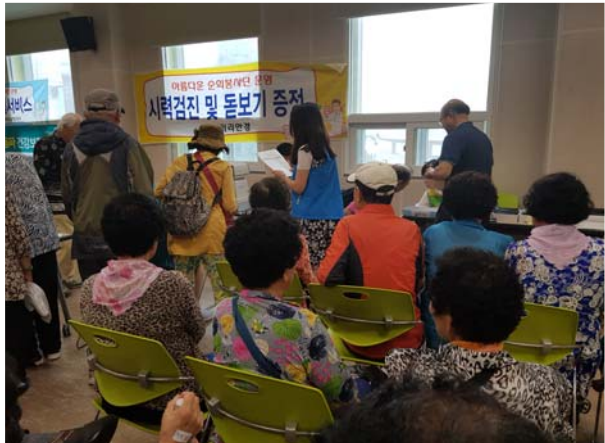
아름다운 순회 봉사단(시력검진)