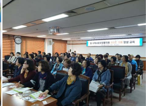
동 지역사회보장협의체 케이트키퍼 양성교육 1