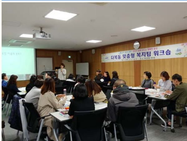
찾아가는 복지팀 워크숍