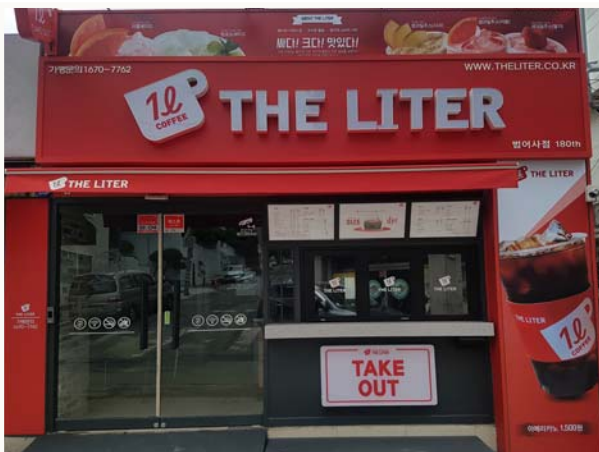
자활기업 「더리터 범어사점」