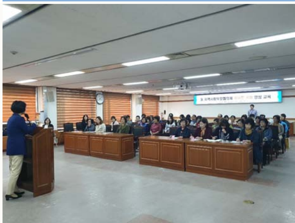
동 지역사회보장협의체 케이트키퍼 양성교육 2