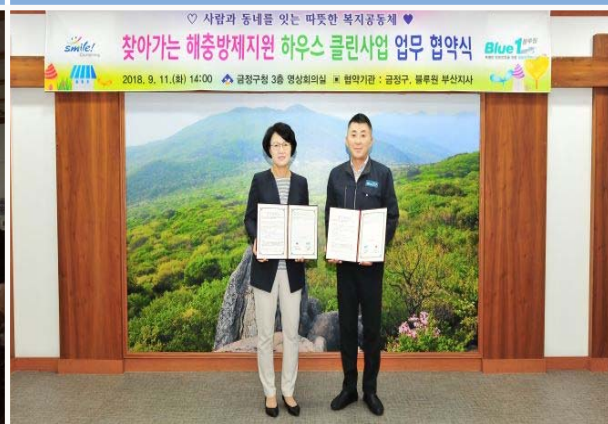
하우스 클린사업(해충방제) 추진