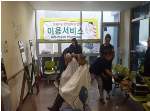
아름다운 순회 봉사단(미용)