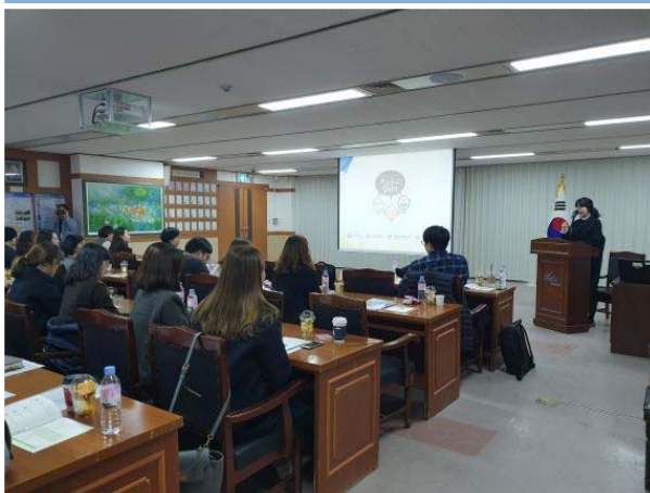
통합사례관리 교육 실시