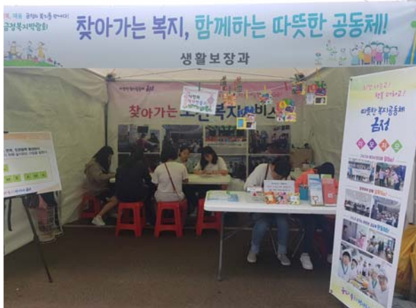
금정복지박람회 찾아가는 복지서비스 홍보부스 운영