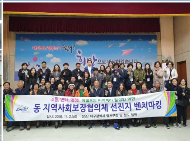
동 지역사회보장협의체 선진지 벤치마킹