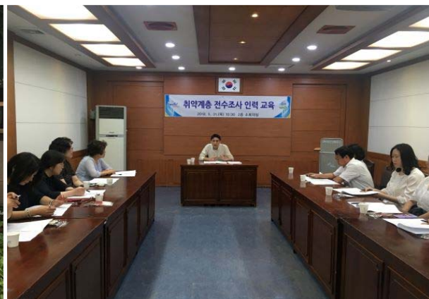
취약계층 전수조사 교육