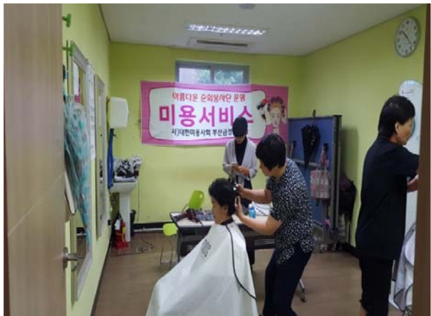
아름다운 순회 봉사단(미용)