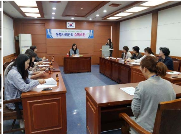
통합사례관리 슈퍼비전 개최