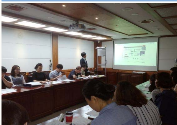
행복충전 희망나눔사업(안심 LED센서등)