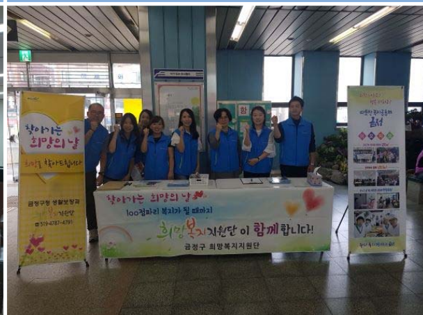
찾아가는 희망의 날 운영