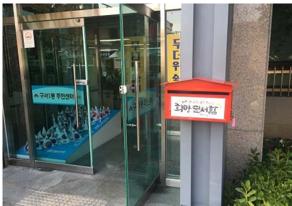
희망우체통 제작 비치