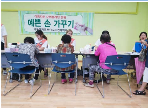
아름다운 순회 봉사단(예쁜 손 가꾸기)