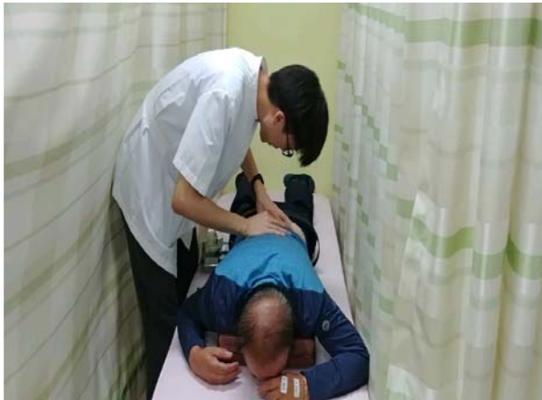
아름다운 순회 봉사단(한방진료)