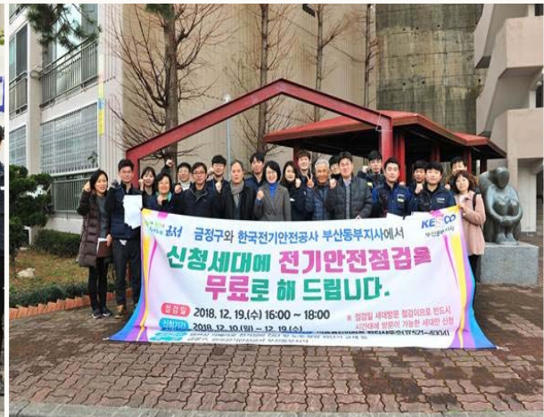
공동주택 전기설비 개선사업 (서동삼한아파트)