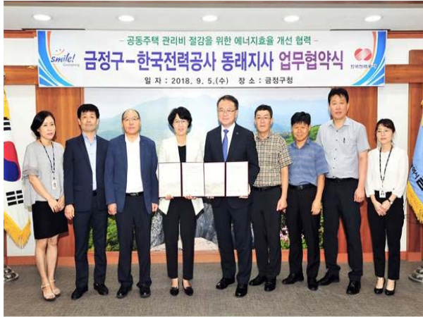
한국전력공사 동래지사와 MOU 체결