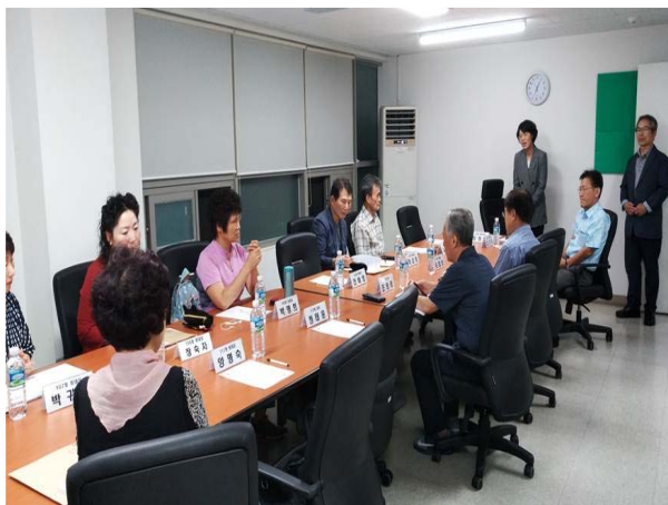
입대의 및 관리주체와의 간담회 1