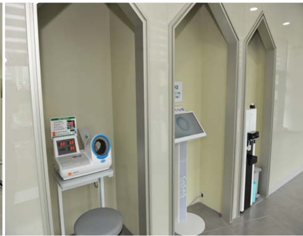
치매안심센터 리모델링 2

구민의 여가 활용과 체력증진을 위하여 부곡동 961번지 일원에 금정국민체육센터가 현재 운영 중이며, 선동 잔디 구장 개장에 따라 이용객의 편의 및 운영에 필요한 화장실 및 창고시설을 2007년 5월에 완공하였고, 2009년 5월에는 부족한 보건소 공간 확보를 위한 별관 2개 층 증축공사가 완료하였으며 2011년에 재난에 대한 이해와 체험을 통한 안전의식 함양의 기회제공을 위하여 민방위 실전훈련센터가 완료되었으며, 2012년에 노후·방치된 건축물을 리모델링하여 남산동 머드레 행복센터 등 주민 편의 공간 확보를 위한 공사 3건을 완료하였다.