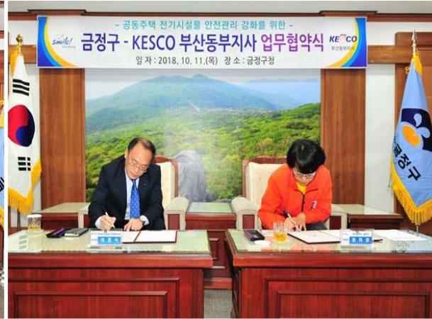
한국전기안전공사 부산동부지사와 MOU 체결