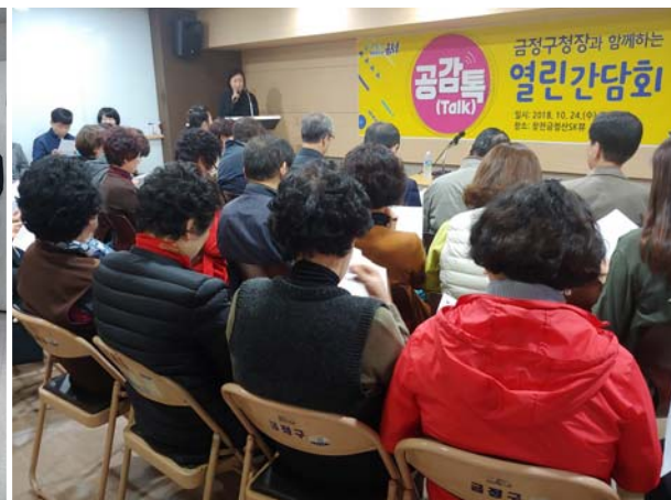
입대의 및 관리주체와의 간담회 2