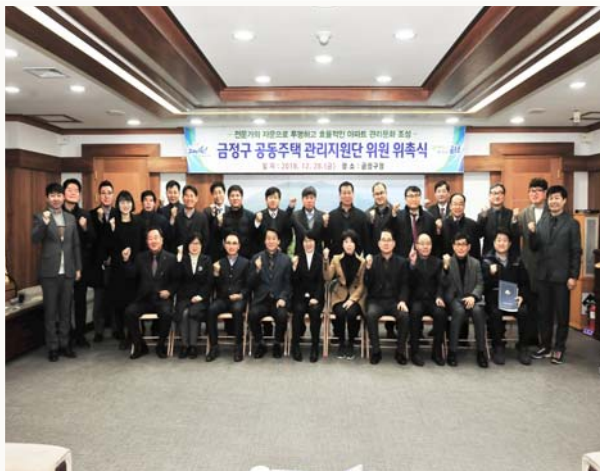
공동주택 관리지원단 위촉식 1