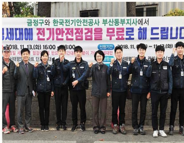
공동주택 전기설비 개선사업 (구서태평양아파트)