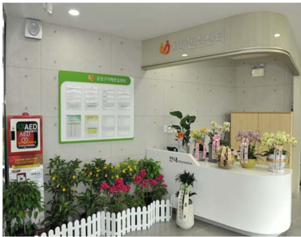
치매안심센터 리모델링 1