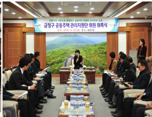
공동주택 관리지원단 위촉식 2